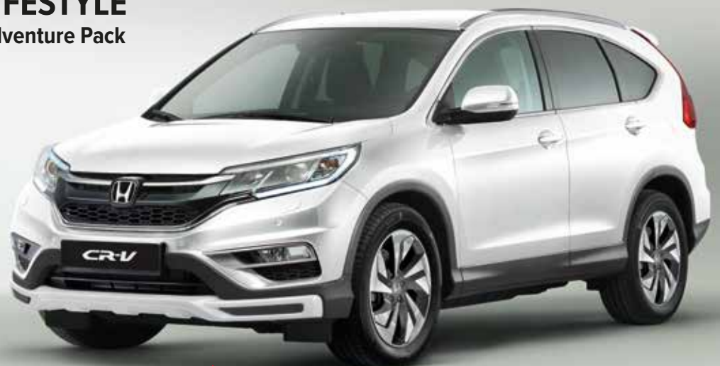
Atgebeeld model: CR-V 1.6 i-DTEC 2WD Lifestyle in White Orchid Pearl met Adventure Pack.