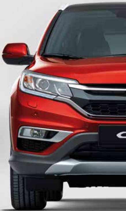
PASSION RED PEARL*