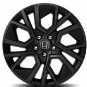
ZWARTE LICHTMETALEN VELG 18" UMBRA