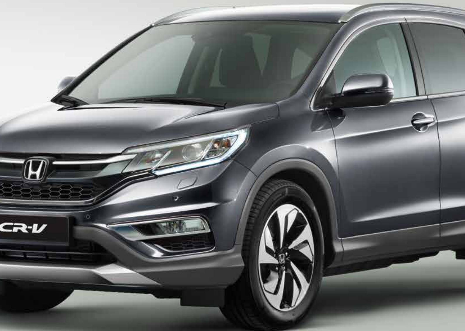
Atgebeeld model: CR-V 1.6 i-DTEC 4WD Lifestyle in Polished Metal Metallic.