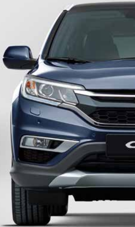
TWILIGHT BLUE METALLIC