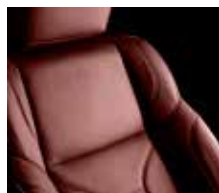
Bordeaux Red / Midnight Black