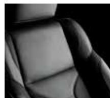
Stone Grey / Country Grey / Midnight Black

De prijs van deze extra optie is te raadplegen in de prijslijst.