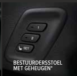
BESTUURERSSTOEL MET GEHEUGEN*