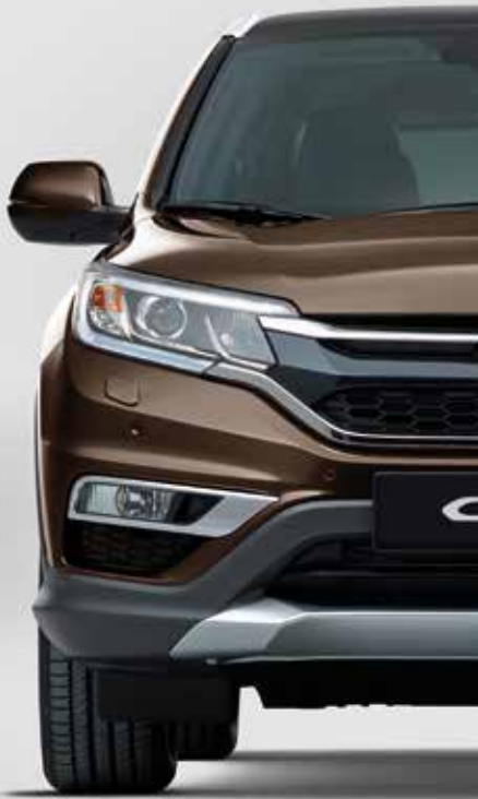
GOLDEN BROWN METALLIC