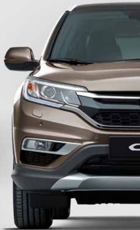
URBAN TITANIUM METALLIC