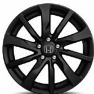
ZWARTE LICHTMETALEN VELG 19" NOX