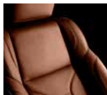
Mokka Brown / Midnight Black