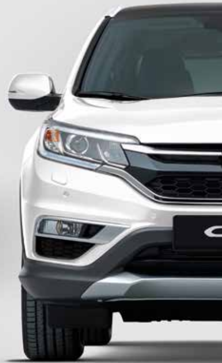
WHITE ORCHID PEARL*