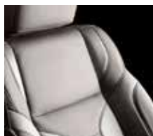
Sand Beige / Warm Beige / Midnight Black